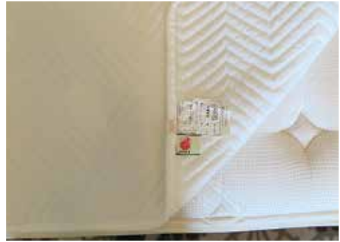
寝具に採用されている防災製品

全国的にシーツ・枕・カバー他リネン類は、デザイン性や快適性のことを考慮し防災製品の採用が進まない状況も見受けられますが、宿泊客の最小限度の安心安全を確保する姿勢の表れでもあり、東京オリンピックを見据え、寝具類に防災製品を採用される宿泊施設が増えることを期待しています。